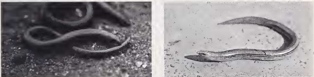
Abb. 2: a) Scelotes brevipes , b) Scelotes gronovii .

Von den drei hier behandelten Arten zeigt S. brevipes die weiteste Verbreitung und scheint sich am besten verschiedenen Mikrohabitaten anpassen zu können. Sie ist von Zululand, dem anschließenden östlichen Transvaal und dem südlichen Moçambique bekannt. Daß S. brevipes nicht nur bevorzugt das sandige bis humusreiche Littoral bewohnt, sondern sich den